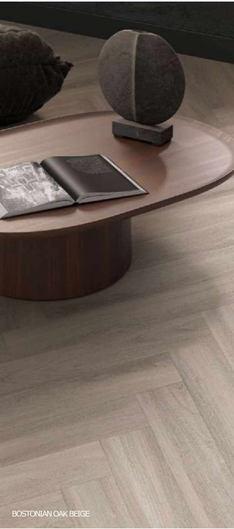
BOSTONIAN OAK BEIGE