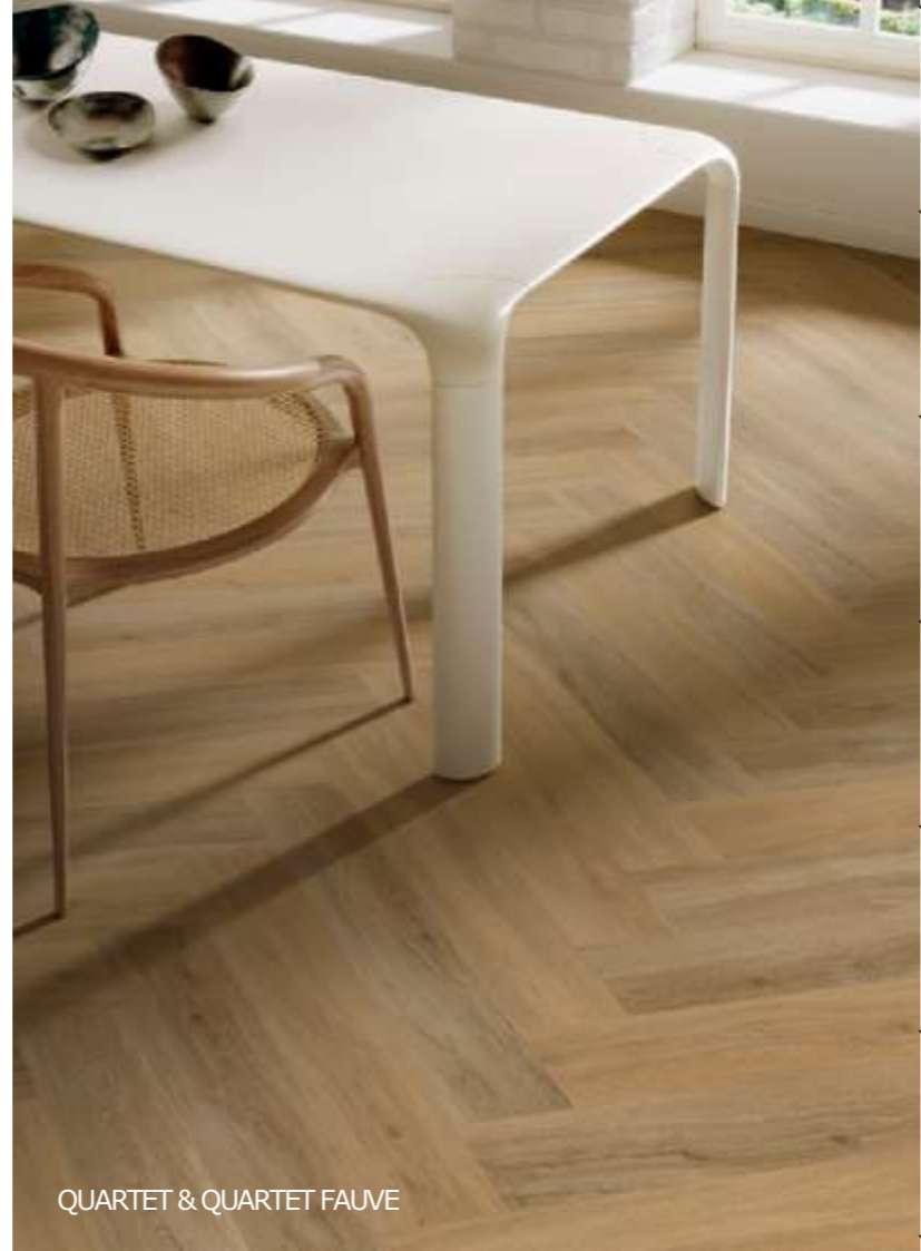
QUARTET & QUARTET FAUVE